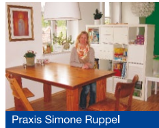
Praxis Simone Ruppel