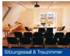
Sitzungssaal & Trauzimmer