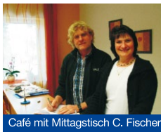
Café mit Mittagstisch C. Fischer