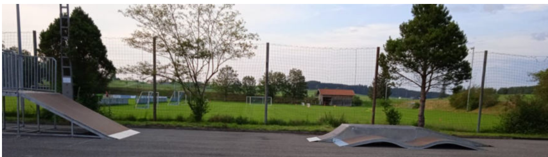
Die Skaterbahn am Stockschützenplatz.

Pünktlich zum Ferienbeginn ist die Skaterbahn aufgebaut worden und wird bereits fleißig genutzt. Wir bedanken uns bei den Stockschützen, dass sie einen Teil ihrer Bahn für die Skateranlage zur Verfügung gestellt haben. Ebenso herzlichen Dank an alle Sponsoren und die Förderung durch das Auerbergland. Die offizielle Einweihung der Skateranlage wird voraussichtlich im Herbst erfolgen.