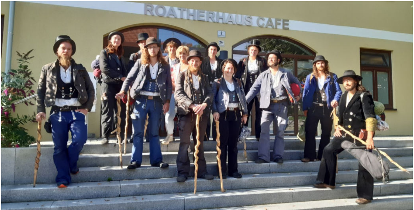
Die Wandergesellinnen und -gesellen bei Ihrem Besuch in der Gemeindeganzlei Burggen.

Im Jahr 2015 wurde die Walz von der UNESCO als Weltkulturerbe anerkannt. Auf die Wanderschaft darf heute nur gehen, wer die Gesellenprüfung bestanden hat, ledig, kinderlos, schuldenfrei und unter 30 Jahre alt ist. Der Bannkreis von 50 km um den Heimatort darf während der Tippelei nur in wenigen, streng geregelten Ausnahmen überschritten werden.