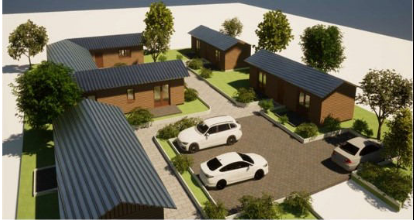
So soll der Modulbau in Burggen voraussichtlich aussehen.

Für die Unterbringung von Asylbewerbern plant der Landkreis Weilheim-Schongau am Ortsausgang Richtung Erbenschwang eine eingeschossige Unterkunft in Modulbauweise für bis zu 32 Personen. Nach Auskunft des Landratsamtes werden die Ausschreibungen für den Bau in Kürze erfolgen. Über den tatsächlichen Baubeginn kann derzeit keine verlässliche Aussage getroffen werden. Aktuell (Stand 01.08.2024) sind 4 Asylsuchende und 9 Personen aus der Ukraine in unserer Gemeinde untergebracht.